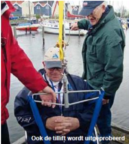
Ook de tillift wordt uitprobeer