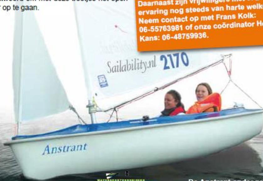
De Anstrant onder zeil