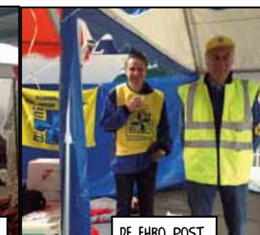
DE EHBO POST