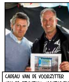
CADEAU VAN DE VOORZITTER VAN DE STICHTING JACHTHAVEN