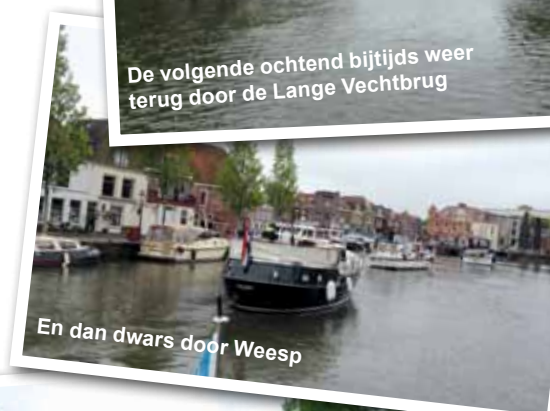
En dan dwars door Weesp