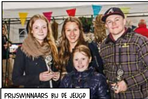
PRIJSWINNAARS BIJ DE JEUGD