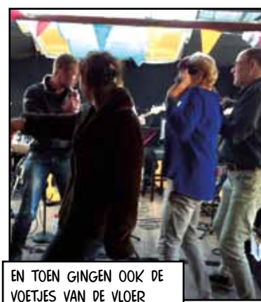
EN TOEN GINGEN OOK DE VOETJES VAN DE VLOER