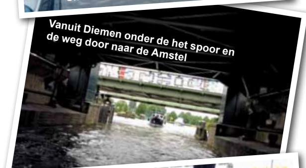
Vanuit Diemen onder de het spoor en de weg door naar de Amstel