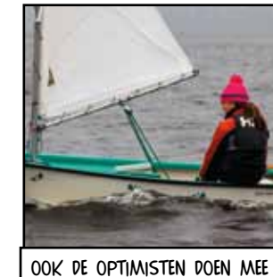
OOK DE OPTIMISTEN DOEN MEE