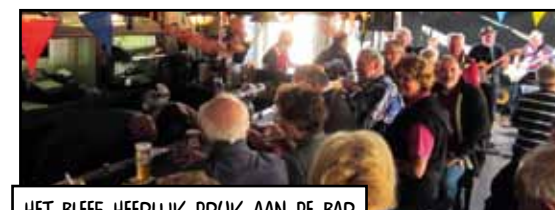
HET BLEEF HEERLIJK DRUK AAN DE BAR