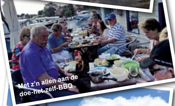
Met z'n allen aan de doe-het-zelf-BBQ