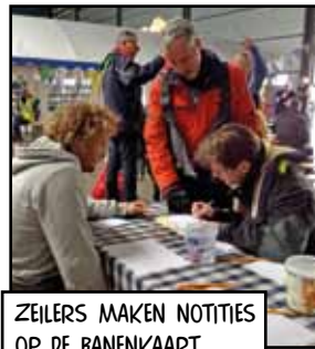
ZEILERS MAKEN NOTITIES OP DE BANENKAART