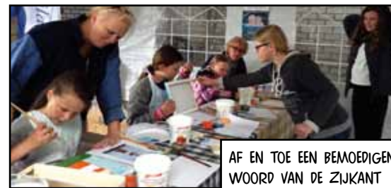
AF EN TOE EEN BEMOEDIGEND WOORD VAN DE ZIJKANT