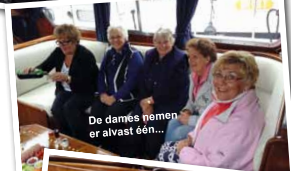
De dames nemen er alvast één...