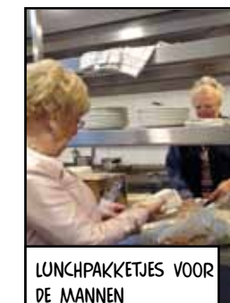
LUNCHPAKKETJES VOOR DE MANNEN