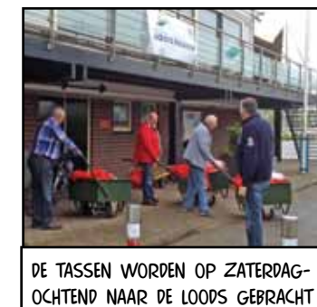
DE TASSEN WORDEN OP ZATERDAG-OCHTEND NAAR DE LOODS GEBRACHT