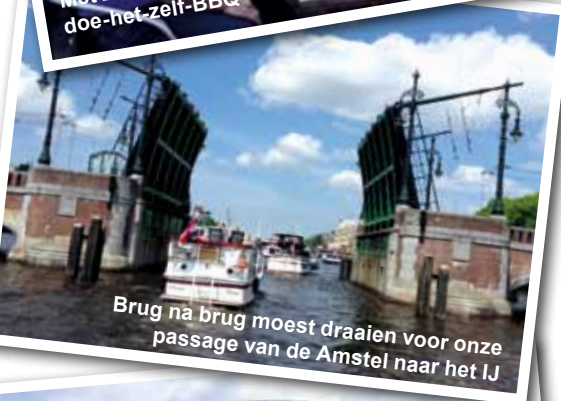
Brug na brug moest draaien voor onze passage van de Amstel naar het IJ