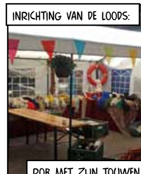
ROB MET ZIJN TOUWEN