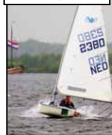
DE SPLASH IN DE RACE