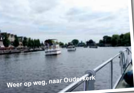
Weer op weg, naar Ouderkerk