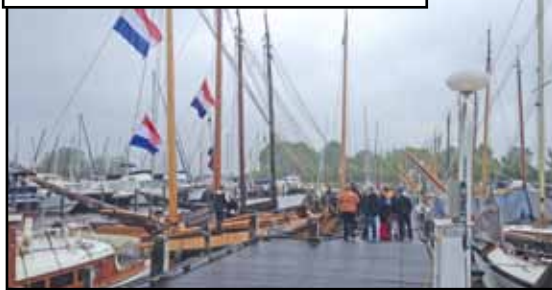
BINNENKOMST VAN DE DEELNEMENDE SCHEPEN

Zaterdag 10 mei was het zover. De ploeg vrijwilligers was al vroeg aanwezig zodat alles in goede banen geleid kon worden. Met elkaar constateerden we dat het helaas een regenachtige en grauwe dag zou worden. Maar dat mocht de pret niet drukken. Vol enthousiasme gingen we van start. De stands in de loods werden gevuld en bemand. Schepen kwamen binnen voor de EemDeltaRace. Koffie en Huizer mannetjes werden genuttigd in de loods. Fijn dat we veel zaken dus binnen konden oplossen. Dank hiervoor aan de Stichting en de havenmeesters. Rond tien uur palaver voor de EemDeltaRace. Het