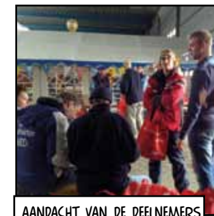
AANDACHT VAN DE DEELNEMERS