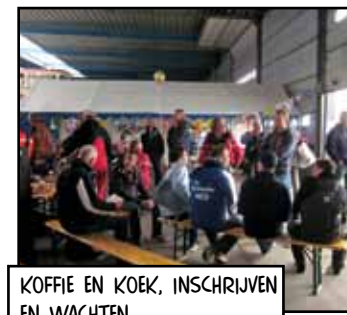
KOFFIE EN KOEK, INSCHRIJVEN EN WACHTEN