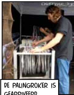
DE PALINGROKER IS GEARRIVEERD