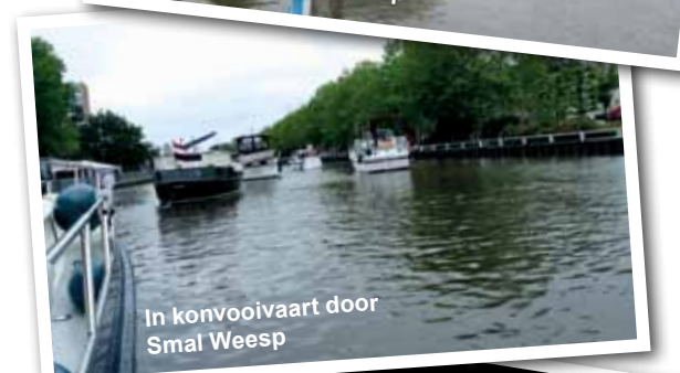
In konvoivaart door Smal Weesp