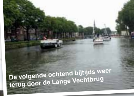
De volgende ochtend bijtijds weer terug door de Lange Vechtbrug