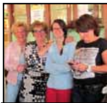
DE BARPLOEG MAAKT ZICH OP VOOR EEN DRUKKE AVOND