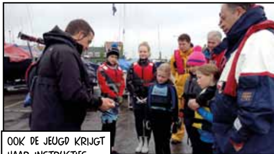
OOK DE JEUGD KRIJGT HAAR INSTRUCTIES