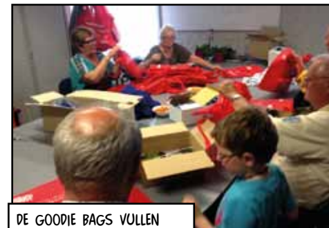
DE GOODIE BAGS VULLEN