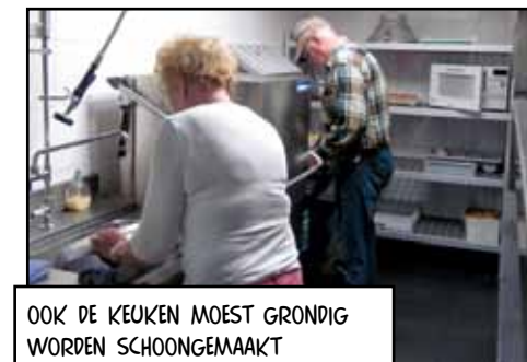
OOK DE KEUKEN MOEST GRONDIG WORDEN SCHOONGEMAAKT