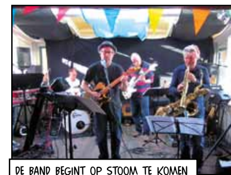
DE BAND BEGINT OP STOOM TE KOMEN