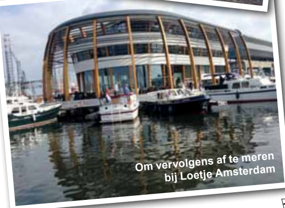
Om vervolgens af te meren bij Loetje Amsterdam

Met de bol gegeten buikjes gingen een aantal schepelingen daarom maar een kleine wandeling maken om alles even te laten zakken. Na een lekker afzakkertje keerde de rust aan de kade weer terug.