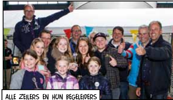
ALLE ZEILERS EN HUN BEGELEIDERS