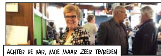
ACHTER DE BAR, MOE MAAR ZEER TEVREDEN

Tot slot nog een dankbetuiging aan onze materiele sponsoren: