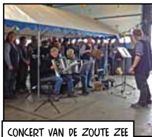
CONCERT VAN DE ZOUTE ZEE