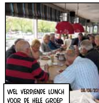
WEL VERDIENDE LUNCH VOOR DE HELE GROEP