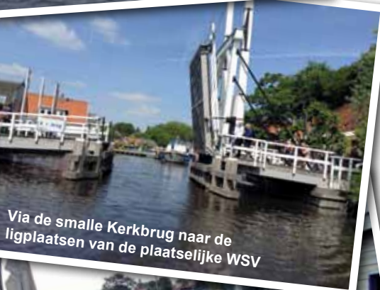
Via de smalle Kerkbrug naar de ligplaatsen van de plaatselijke WSV