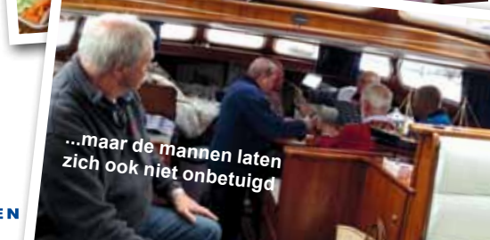
...maar de mannen laten zich ook niet onbetuigd