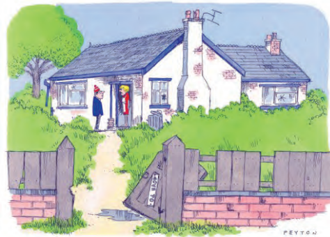
" He's out, working on his boat "

Vrijdag 23 maart Voorjaarsledenvergadering 20.15 uur in De Stuurhut Noteer het in uw agenda!